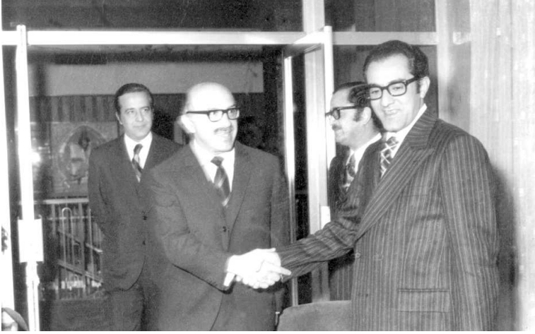
زيارة كولنكيان إلى وزارة التخطيط