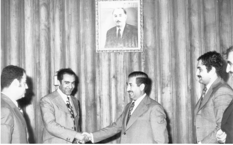
بعد العودة من الاختطاف إلى إسرائيل: مرتضى سعيد عبد الباقي (وزير الخارجية) يستقبل جواد هاشم في مطار بغداد، وبدا على اليمين حامد حمادي وعلي اليسار الدكتور عامر خياط وحميد يونس