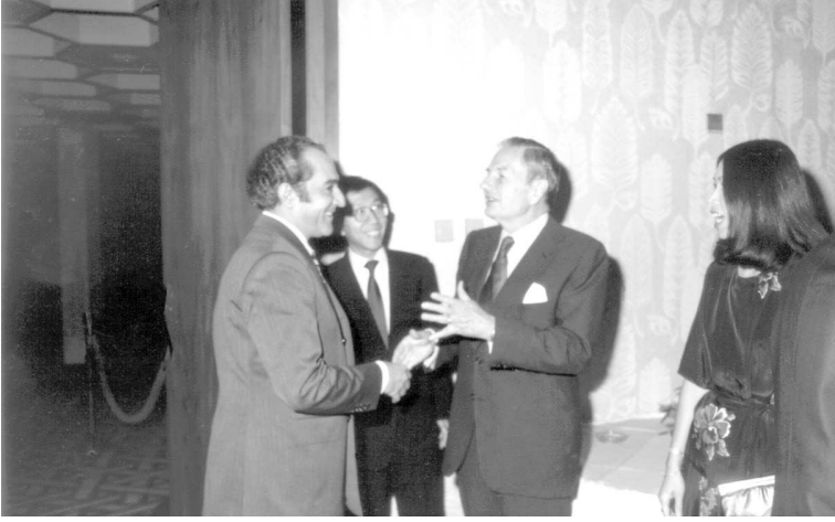
جواد هاشم وديفيد روكفلير