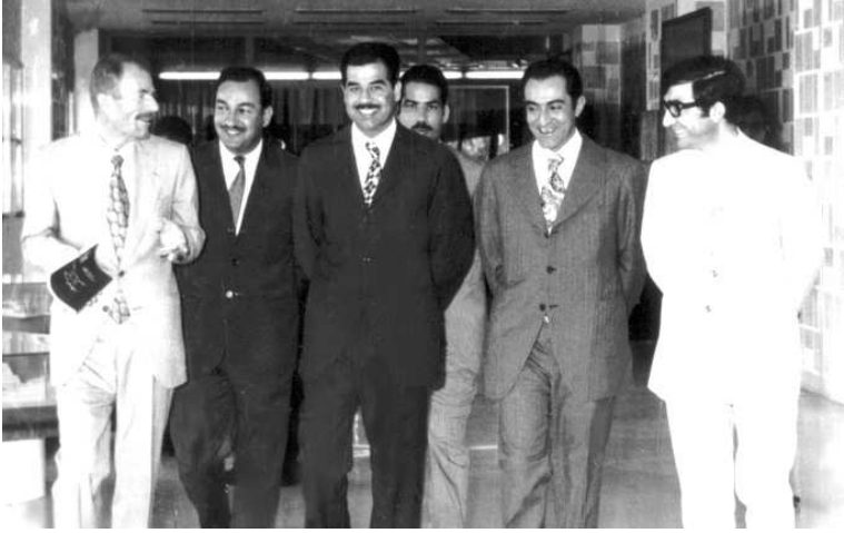
وزارة التخطيط. من اليسار: عزت إبراهيم، قحطان لطفي علي، صدام حسين (ويظهر خلفه برزان التكريتي)، جواد هاشم وصلاح الشبخلي