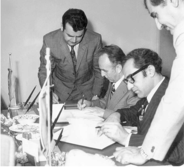
جواد هاشم وغيرهارد شرودر يوقعان اتفاقية التعاون بين العراق وألمانيا (الديموقراطية السابقة) وتشكيل لجنة التخطيط المشتركة