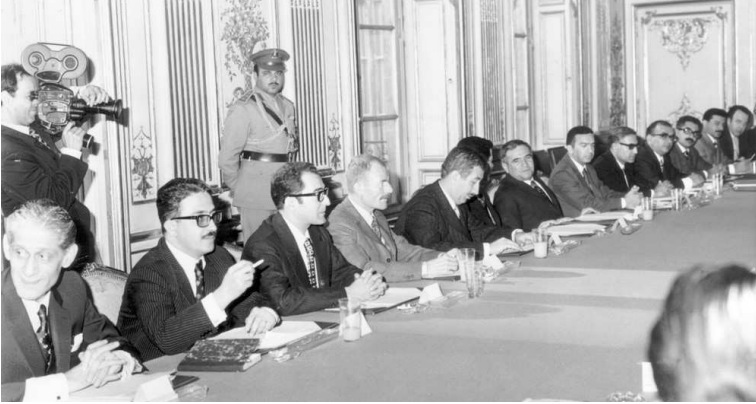
قصر الإليزيه في باريس. من اليسار: سفير العراق في باريس نعمة النعمة، طارق عزيز، جواد هاشم، عزت إبراهيم، مرتضى سعيد عبد الباقي، صدام حسين، عزت مصطفى، سعدون حمادي، فخري قدوري، شاذل طاقة، عدنان القصاب، عدنان الحمداني وفاضل الجلي