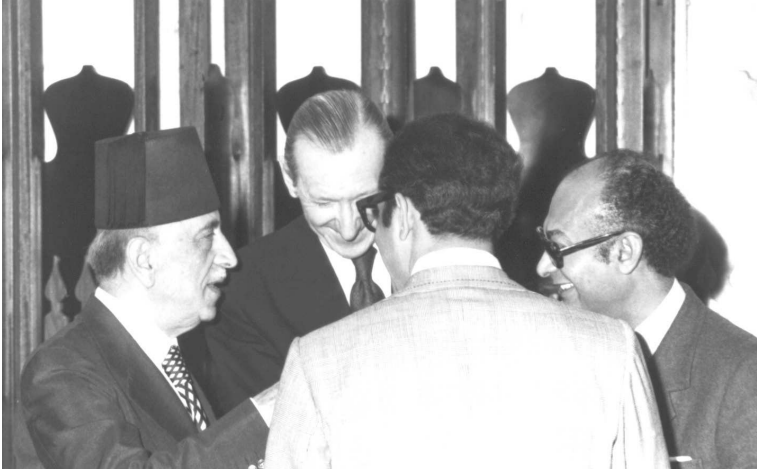
من اليسار: تقي الدين الصلح (رئيس وزراء لبنان) وكورت فالدهايم (الأمم العام للأمم المتحدة)، الدكتور محمد سعيد العطار (رئيس منظمة الأكوا) وجواد هاشم يستدير نحو الكاميرا