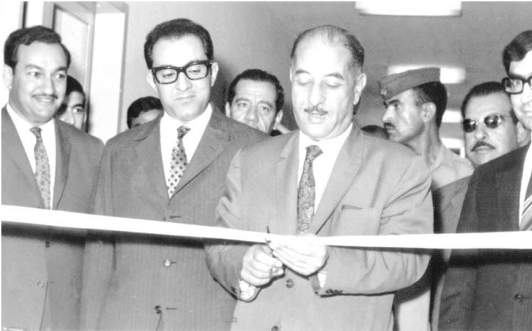
أحمد حسن البكر يفتتح الحاسبة الالكترونية في وزارة التخطيط. من اليسار: قحطان لطفى علي، جواد هاشم وصلاح الشبخلي