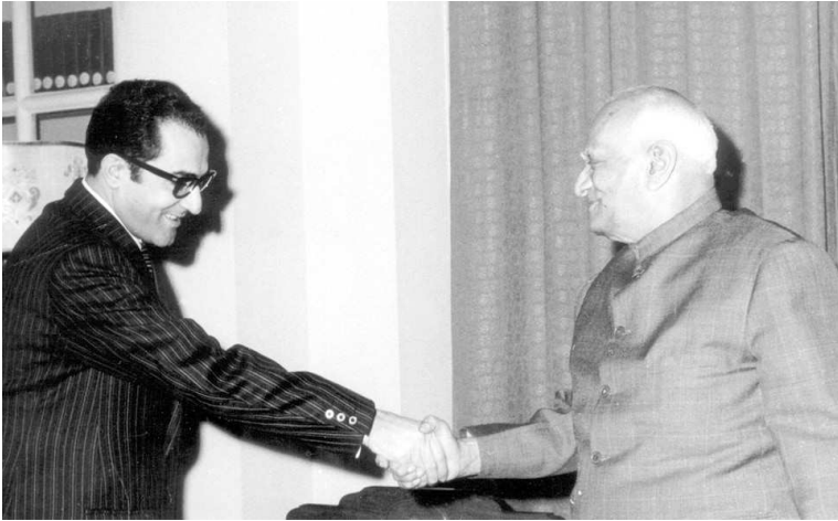
نيودلهي ١٩٧٢. رئيس جمهورية الهند لدى استقباله جواد هاشم