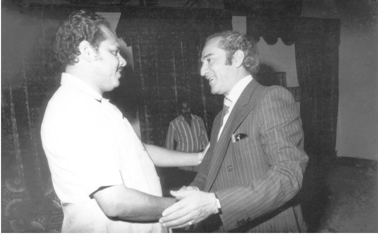
جواد هاشم وعلي ناصر محمد (رئيس جمهورية اليمن الديمقراطية السابقة)